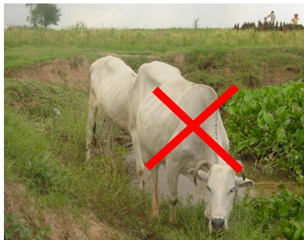
បញ្ចៀសសត្វទឹក ស៊ីស្មៅ រុក្ខជាតិទឹកជាទឹកនៃឆ្នងជំងឺ

-បំបាត់ខ្យងលីមណេអា ដែលជាម្ចាស់កណ្តាលព្រូន ហ្វាស្យូឡា ដោយការចិញ្ចឹមទា និងត្រី ។