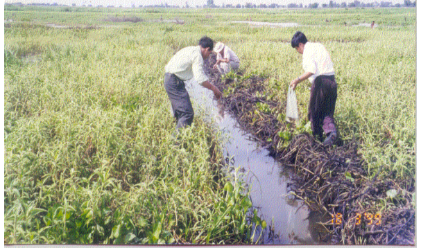
ទឹកន្លែងរស់នៅខ្យងលីមណេអា