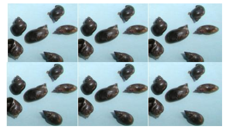
ខ្យងលីមណេអា